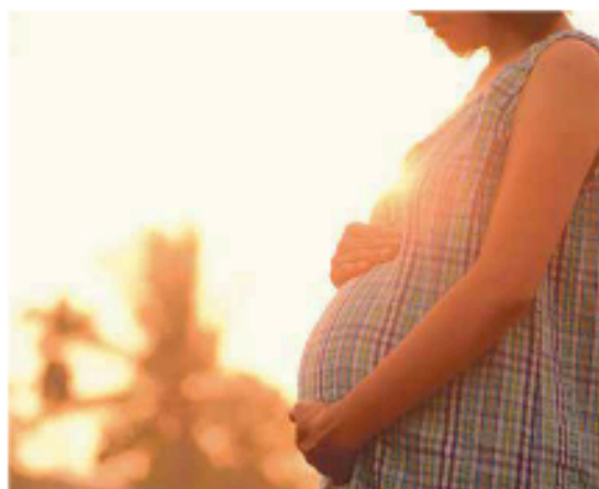
Der Wunsch nach endlich einem Kind ist ein

Ungewollte Kinderlosigkeit kann viele Gründe haben: Genetische oder organische Ursachen, Störungen von hormonellen Problemen bis zur Qualität des Spermias sind medizinisch abzuklären. Eine ungesunde Lebensweise, starkes Übergewicht und das Alter können die Fruchtbarkeit und Zeugungsfähigkeit jedoch ebenso beeinträchtigen. Und manchmal liegt es einfach an mangelndem Wissen über die Vorgänge im Körper: Viele Paare glauben etwa, den Zeitpunkt des Eisprungs anhand der Zykluslänge